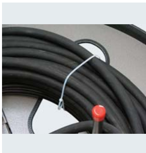
Einfaches Fixieren der Schläuche