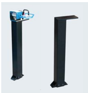
Zubehör : Standfuss 514.1 für UMS 4 (Höhe 840 mm)