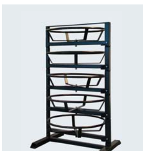
Zubehör: USH 4