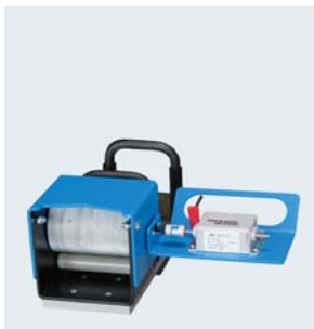
Zubehör: UMS 4 Längenmessgerät