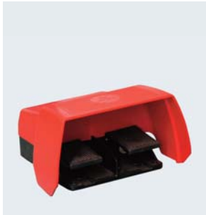
Fußpedal mit Rechts- / Linkslauf