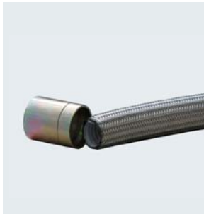
Fassung sofort einsteckbar