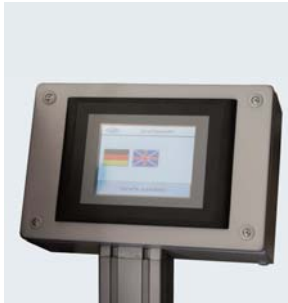
Sprachen Deutsch / Englisch (größeres Display optional)