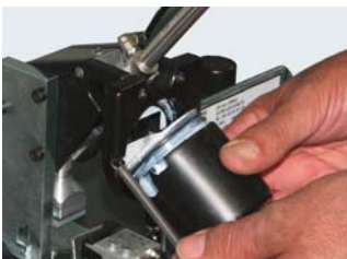
einfaches und schnelles Wechseln der Tintenkartusche Tintenschutz gegen Austrocknen