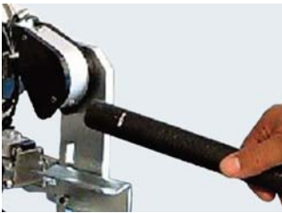
Strichbreite 2 mm